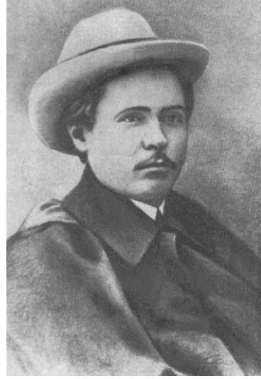
de Veli adlı